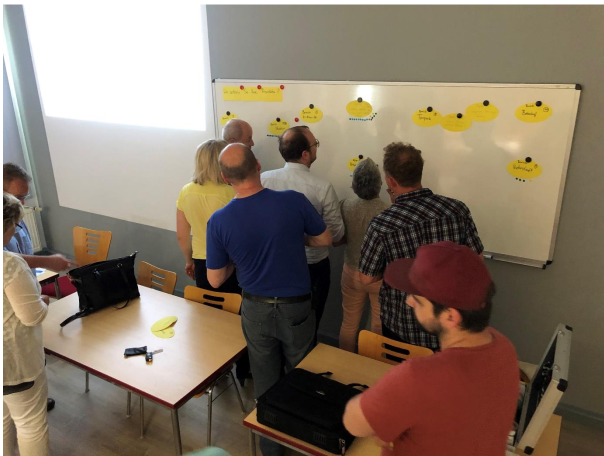
Bürgerworkshop Falkenstein/Vogtl., 18.05.2022

Zusätzlich fand am 18. Mai 2022 ein Bürgerworkshop statt, in dem sich die Teilnehmer über mögliche Maßnahmen im EFRE-Gebiet austauschten. Unter anderem entwickelten Schüler der Oberschule im Bürgerworkshop Ideen, wie das Außengelände der Schule für sie attraktiver gestaltet werden könnte. Die Teilnehmer am Workshop gaben den Projektideen zum Abschluss Punkte, um diese zu priorisieren.