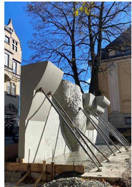
Die frisch betonierte Kletterwand!