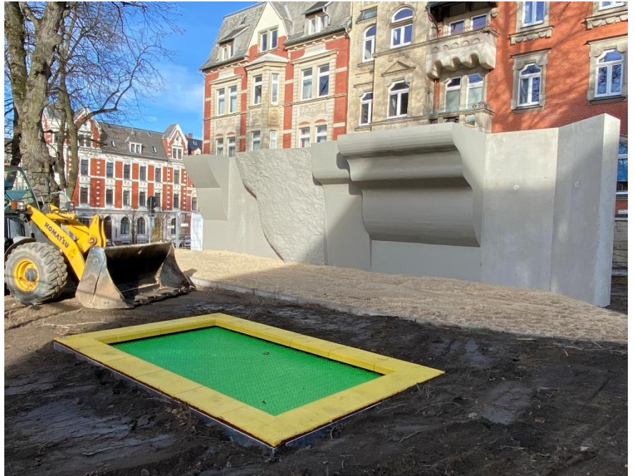
Es fehlen nur noch die Kletterelemente und die Pflanzarbeiten.